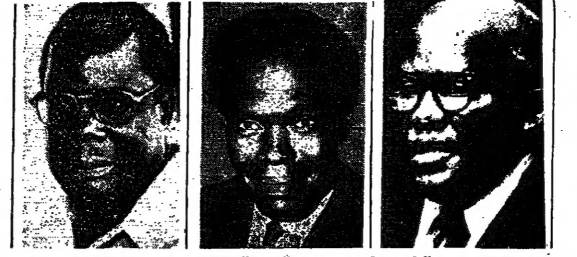
يوسف كرامي الرئيس، ابراهيم ابو يوسف مستعد للعودة الى اوغندا، بول موانزا رئيس الجبهة الوطنية لتحرير اوغندا

قلم عدد من العسكريين من الموالين للرئيس الاسبق ابوتسي بالاستيلاء على السلطة في اوغندا... ابوتسي